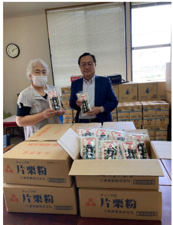
NPO 法人フードバンク東北 AGAIN にて (左:フードバンク担当者、右:弊社芳賀社長)